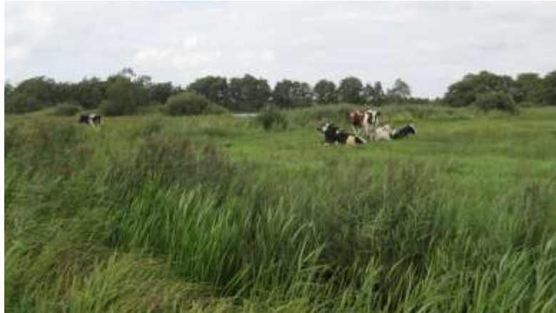
Sluiterspoel op de achtergrond.