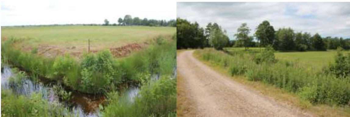
Links: Zicht op de toekomstige streektuin gezien van de deels omgelegde Gaestmabuorren. Rechts: pad langs Wide Ie met aan de rechter/noordzijde de plek voor een werkschuur annex ontmoetingsgebouw.

"Als er niets gebeurt, moet er eerst iets gebeuren, voordat er iets gebeurt. Dus moet je iets laten gebeuren. En dat is logisch!" (Cruijffiaans).