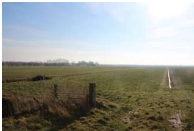
De Warren vanaf Gaestmabuorren met het open veenweidegebied rechts en het coulisselandschap links op de achtergrond.